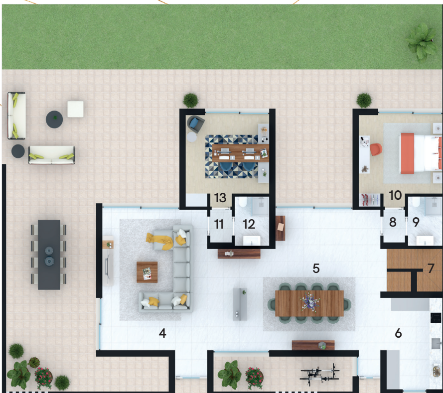
Planta Piso 1