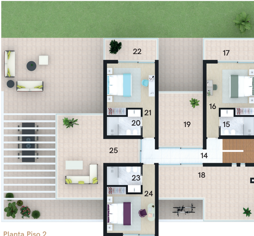
Planta Piso 2