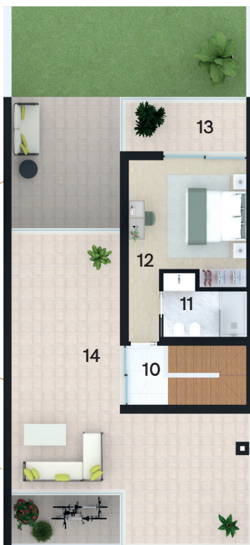
Planta Piso 2