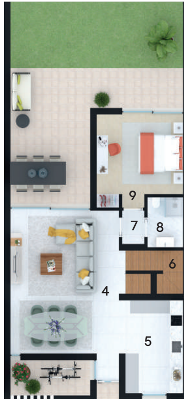
Planta Piso 1