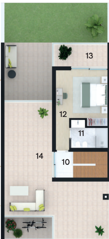
Planta Piso 2