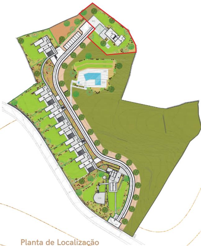
Planta de Localização