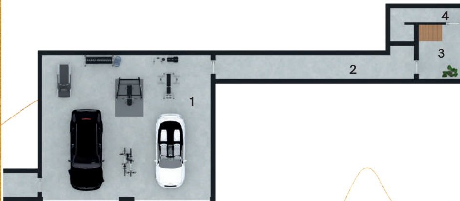
Planta Piso -1